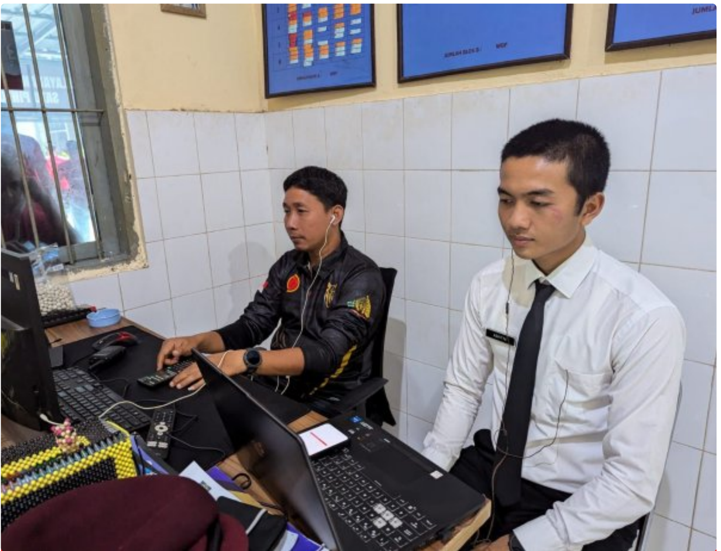
Dukung Kemajuan Organisasi, CPNS Lapas Besi Ikuti Seminar Rancangan Aktualisasi

CILACAP – Calon Pegawai Negeri Sipil (CPNS) Lapas Kelas IIA Besi Nusakambangan mengikuti kegiatan seminar rancangan aktualisasi dalam kegiatan pelatihan dasar yang diselenggarakan oleh Balai Diklat Kemenkumham Jawa Tengah, Jumat (18/10/2024).